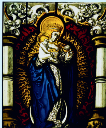
Aus dem Kirchenarchiv

Im September 2001 stahl ein Kunstliebhaber das Glasgemälde mit der Mondsichelmadonna aus dem Chor der Kirche, um damit sein Zimmer zu schmücken. Erst im Advent 2013 fand das Kunstwerk seinen Weg zurück in die Kirche.